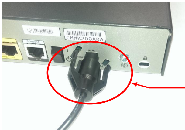
コンセント留め具